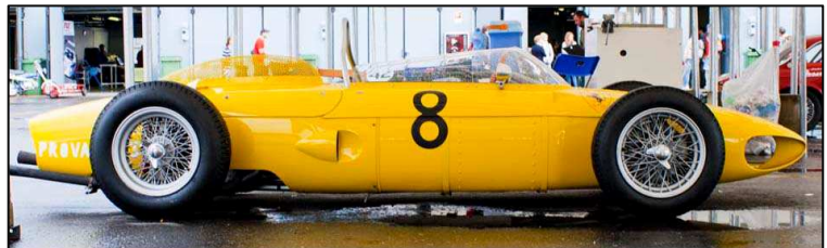
La Ferrari 156 del 1961

cinquantanovesima, mi è parsa risentire della crisi, visto che i partecipanti alle gare erano certamente meno degli altri anni, anche se va notato che il livello qualitativo era molto alto: basti citare la Ferrari 156 del 1961 nella colorazione gialla della scuderia Francorchamps o la Alfa Romeo