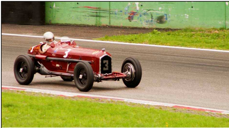
La mitica Alfa Romeo P3 del 1934

cinquantanovesima, mi è parsa risentire della crisi, visto che i partecipanti alle gare erano certamente meno degli altri anni, anche se va notato che il livello qualitativo era molto alto: basti citare la Ferrari 156 del 1961 nella colorazione gialla della scuderia Francorchamps o la Alfa Romeo