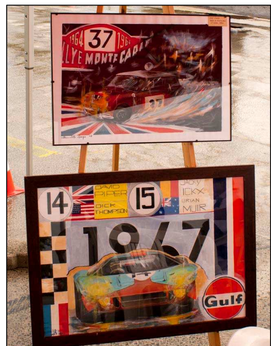
Due opere di Giorgio Benedetti

del biglietto. Comunque il M.A.M.S., a dispetto degli scrosci d'acqua che hanno caratterizzato tutti e due i giorni della manifestazione, è stato presente in forze con le vetture dei propri soci esposte in