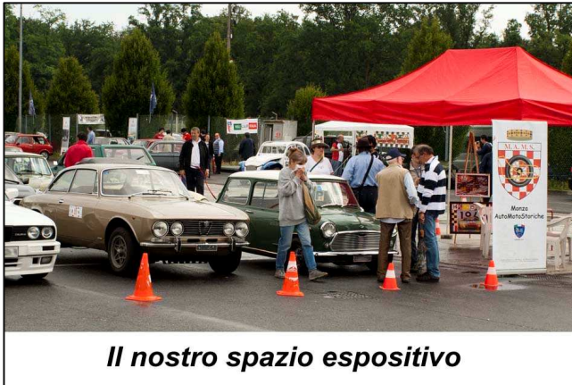
Il nostro spazio espositivo

Il maltempo, ampiamente previsto dai vari bollettini meteo, ha evidentemente sconsigliato la presenza delle vetture più antiche, per cui le auto esposte dal club erano principalmente appartenenti agli anni 60 e 70. Erano rappresentate le più importanti marche del settore: Alfa Romeo, BMW, Porsche, Lancia, Innocenti Mini, Triumph, Ferrari e Mustang.