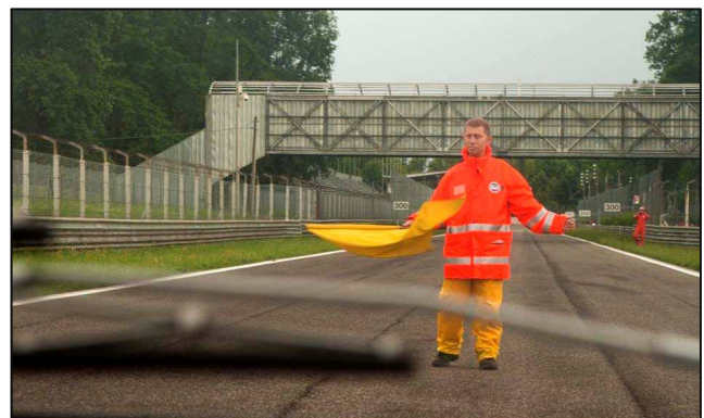
La fine della parata (il commissario non è stato investito, ho sterzato in tempo)

Oltre alla mostra statica i soci hanno avuto la possibilità di effettuare un paio di giri di pista durante la parata dei club.