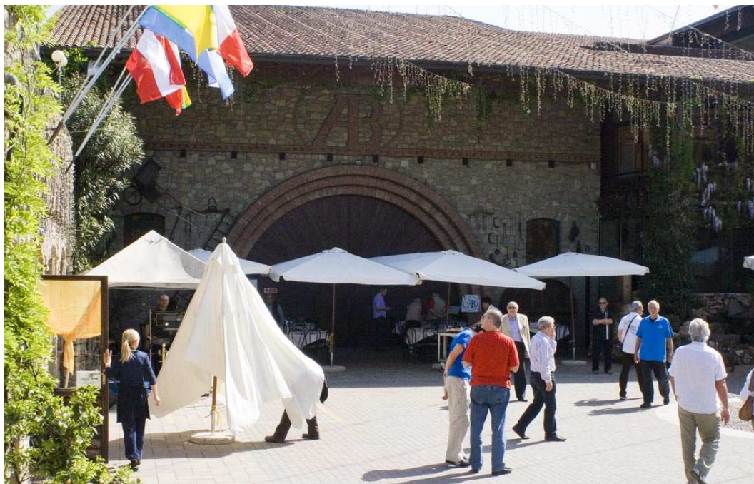
LA CORTE DELLA CANTINA DELL'AZIENDA AGRICOLA BOSCHI

giro della Franciacorta si è snodato fra dolcissime colline ed improvvise visioni di castelli, chiese e ville, rese ancor più belle dal sole e dal lento passaggio delle nostre veterane.