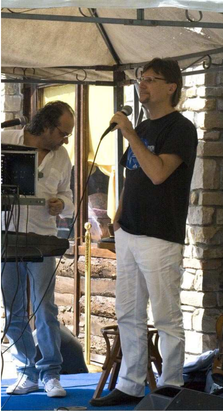
ALCUNI NOSTRI SOCI SI SONO ANCHE CIMENTATI IN ESIBIZIONI CANORE