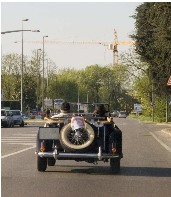
IN MARCIA VERSO LA FRANCIACORTA.

Di buon mattino, i partecipanti hanno cominciato ad affluire al consueto punto di raccolta in piazza Citterio. Lì, non ce ne vogliono gli altri soci, la vedette è stata la Maserati 3500 GT, appartenuta a Gino Bartali, che ha sfoggiato le linee purissime che la caratterizzano, emblema dello stile italiano della fine degli anni 50/inizio degli anni 60. Faceva da contraltare alla Maserati una tipica rappresentante dello spirito automobilistico anglosassone, una MG TD del 1953.