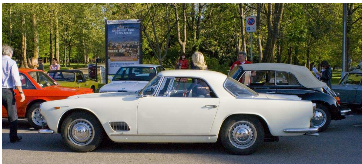
PARTENZA DAL CONSUETO PUNTO DI RITROVO IN PIAZZA CITTERIO. IN PRIMA FILA UNA STUPENDA MASERATI 3500 GT

Il secondo raduno della stagione, al contrario del primo, è stato favorito dal bel tempo: un sole più estivo che primaverile ha favorito la partecipazione dei soci. Le nostre vetture, che durante l'inverno si erano assopite, sono tornate a spuntare come primule all'arrivo del primo sole, pronte per sgranchirsi le ruote lungo le strade della Franciacorta.